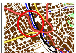
Menden, Unnaer Landstraße/ Alte Provinzialstraße