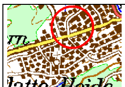
Menden-Papenbusch, Am Papenbusch