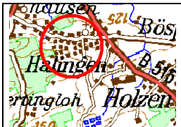
Ortsteil Halingen (Mitte)