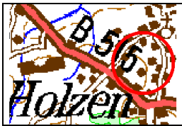
Menden-Holzen (südwestlich Böisperde)