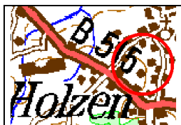
Menden-Holzen, zwischen Heidestr., Holzener Dorfstraße und Provinzialstraße