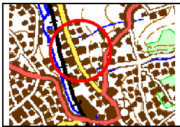
Menden-Ohl (zwischen Werler Straße/ Fröndenberger Str./ Mühlenweg)