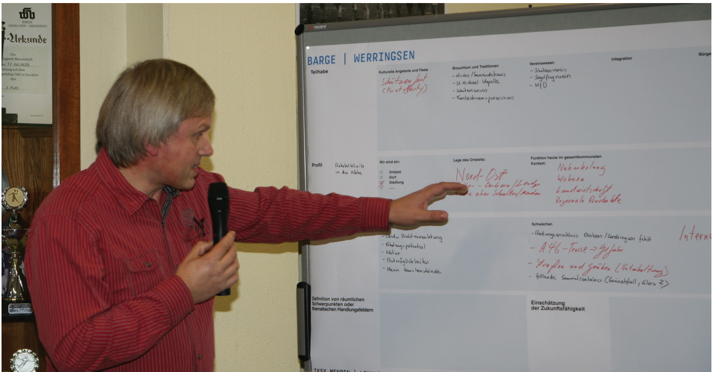
Präsentation der Arbeitsinsel Barge | Werringsen