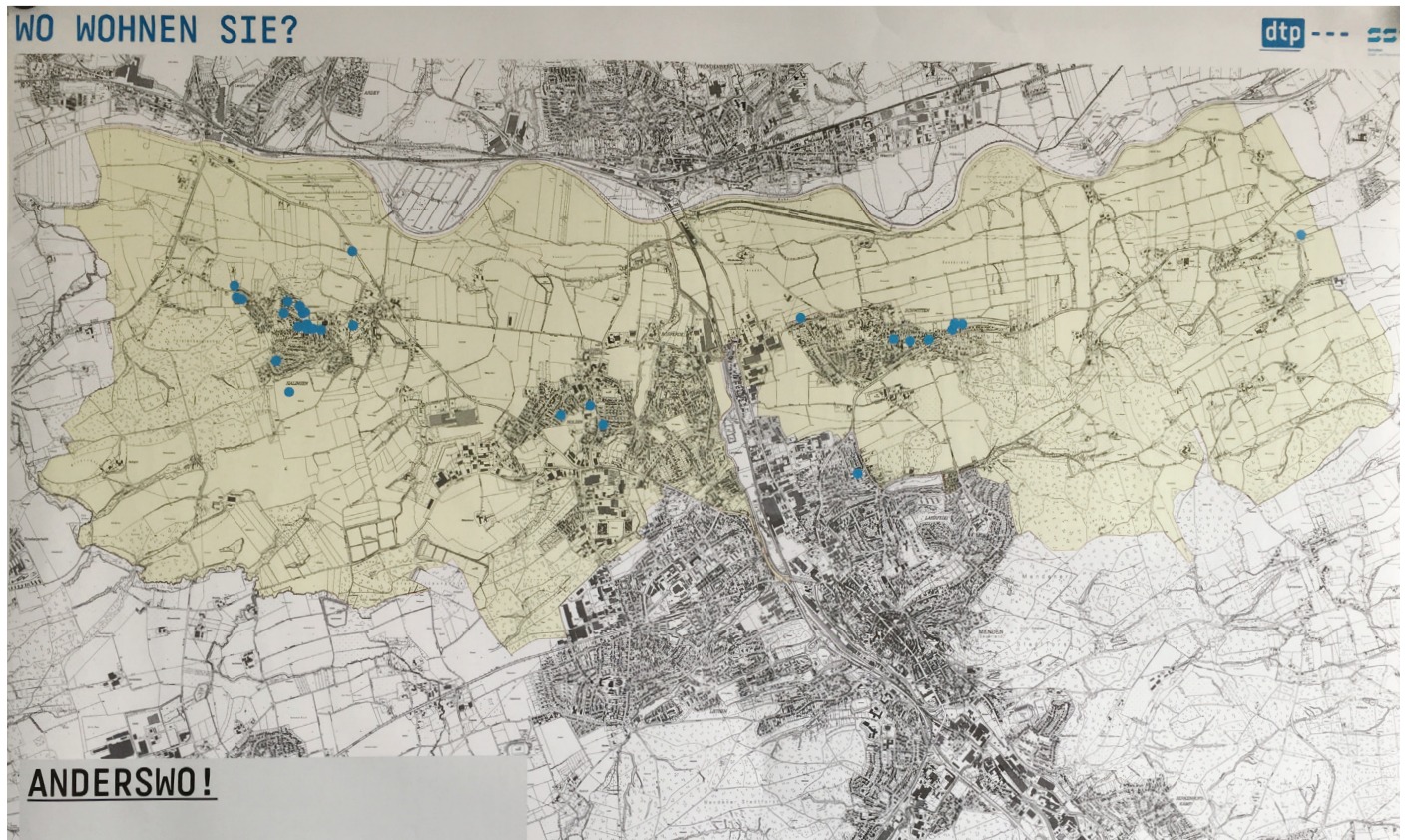
Markierung des Wohnortes auf einem Lageplan der Stadtteile