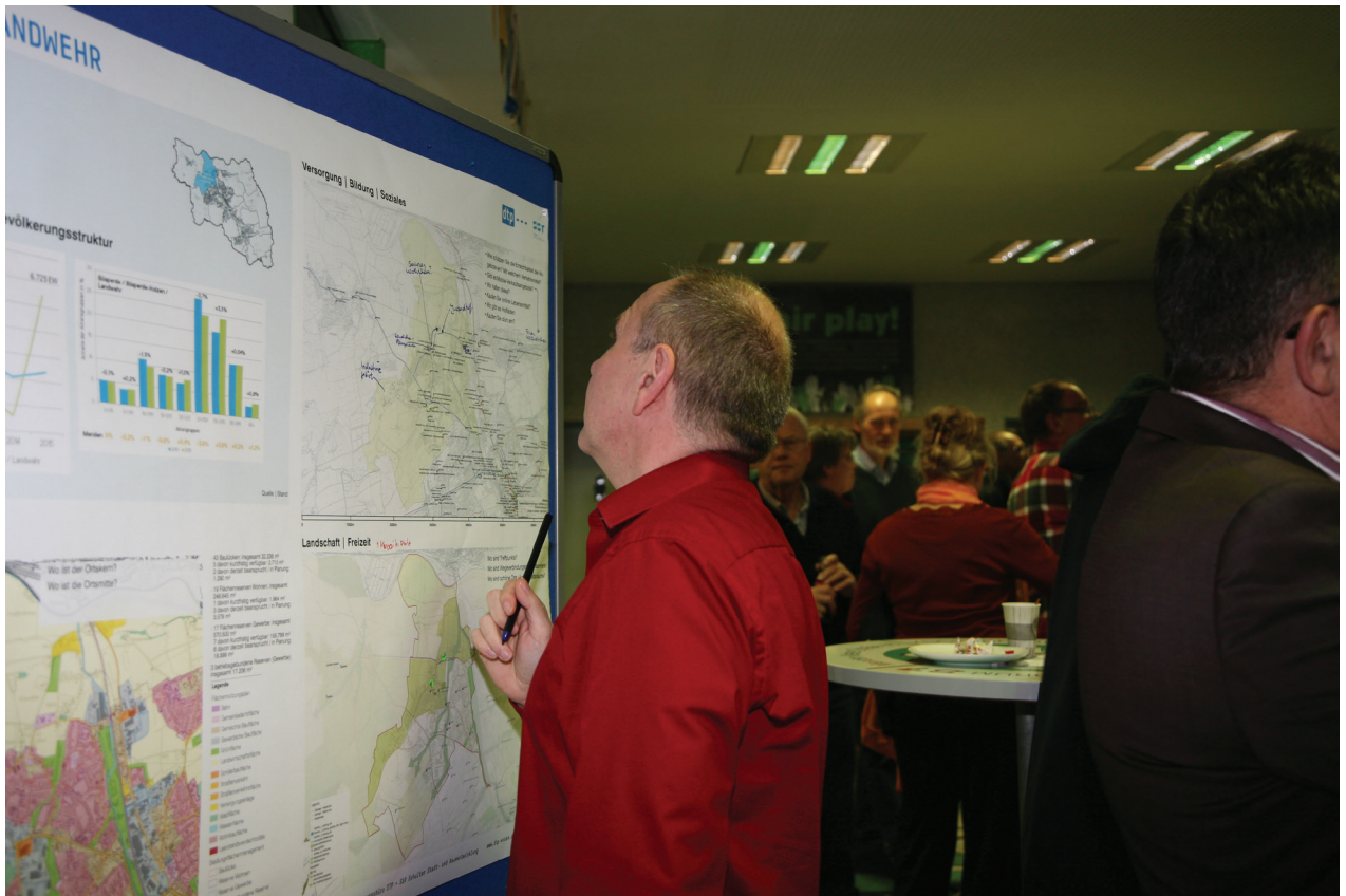
Arbeit in den Ortsteilen, hier Böspersde | Landwehr