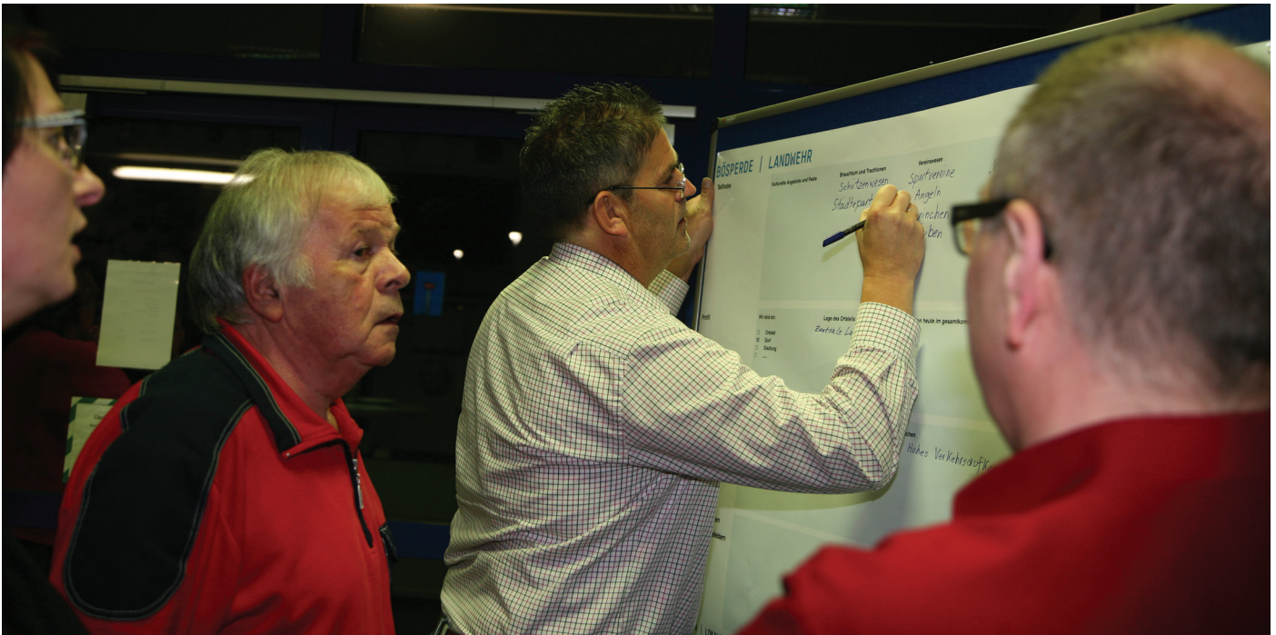
Arbeitsinsel Böisperde | Böisperde Holzen | Landwehr