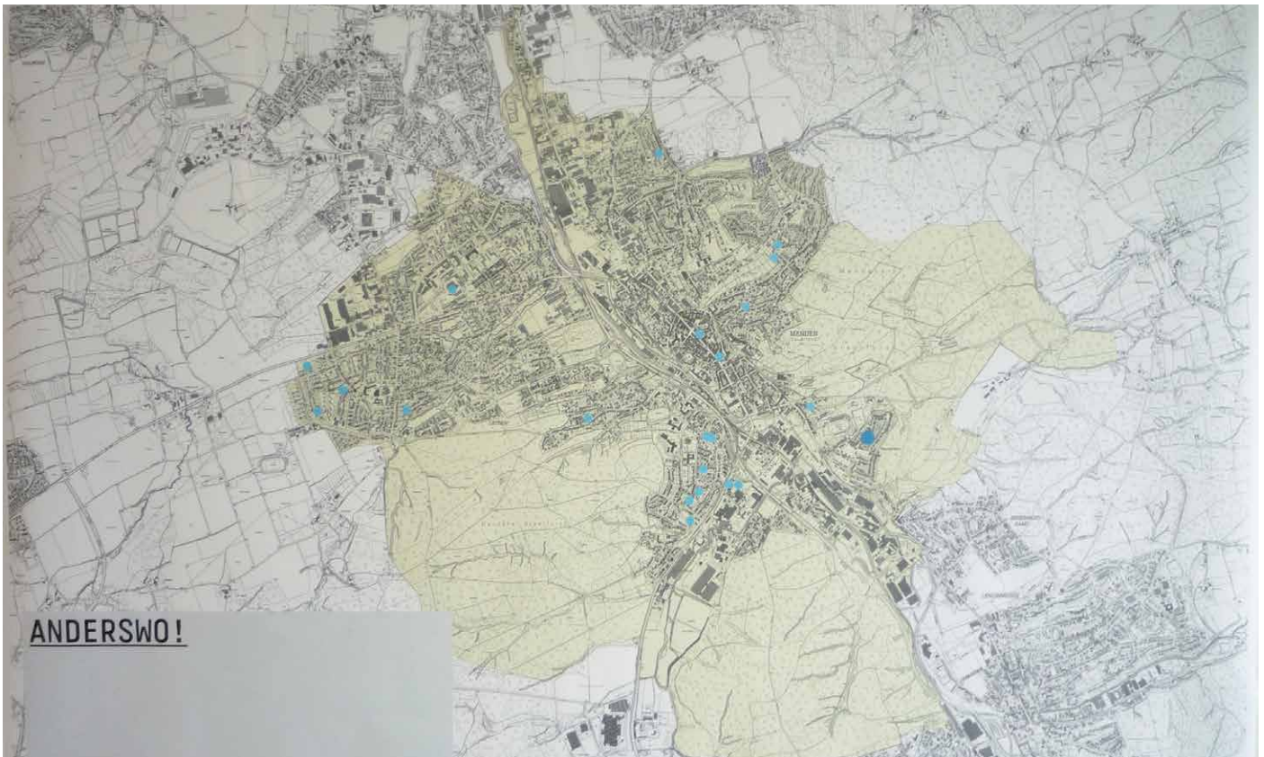
Markierung des Wohnortes auf einem Lageplan der Stadtteile