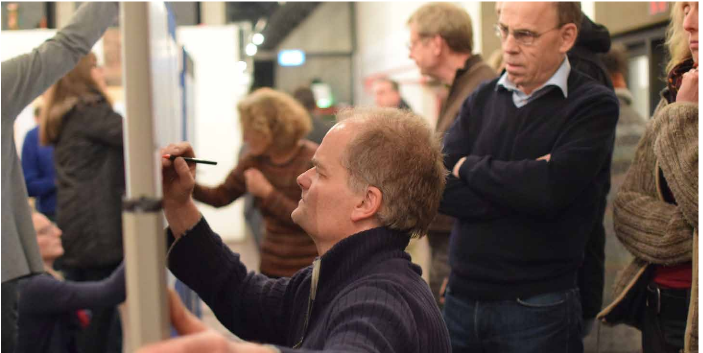
Arbeitsinsel Obsthof / Horlecke