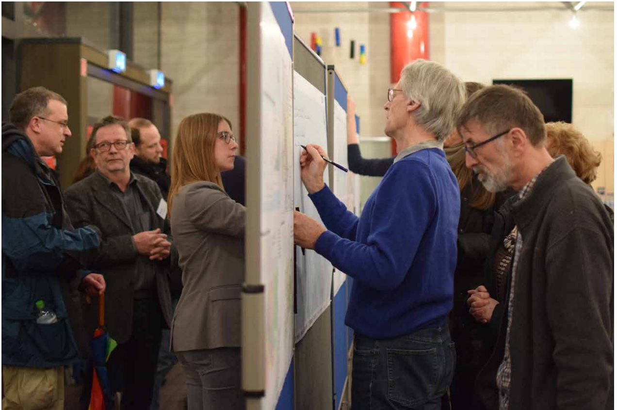
Arbeit an den Orteilsteilplakaten