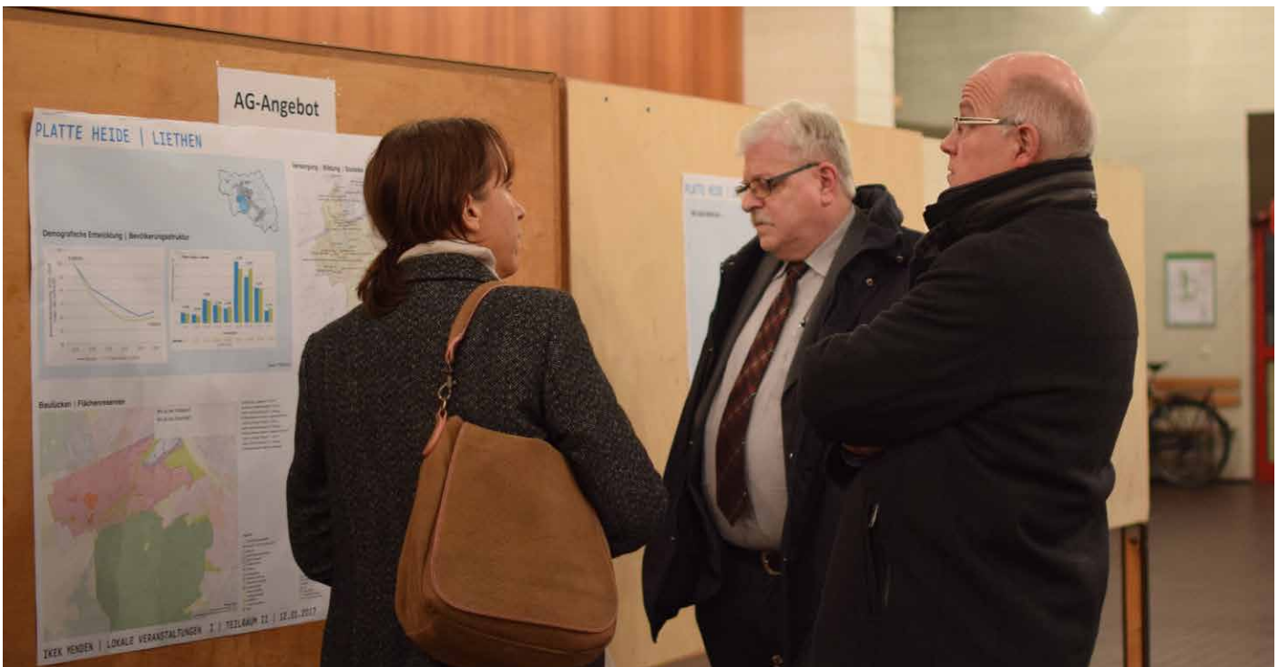
Arbeitsinsel Platte Heide / Liethen