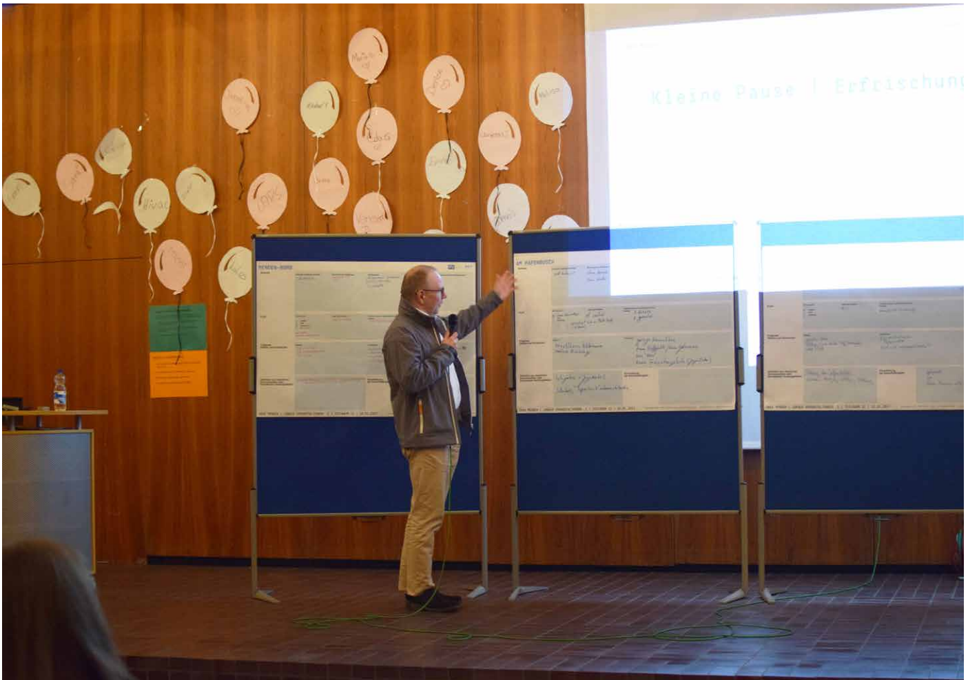
Vorstellung der Ergebnisse Am Papenbusch