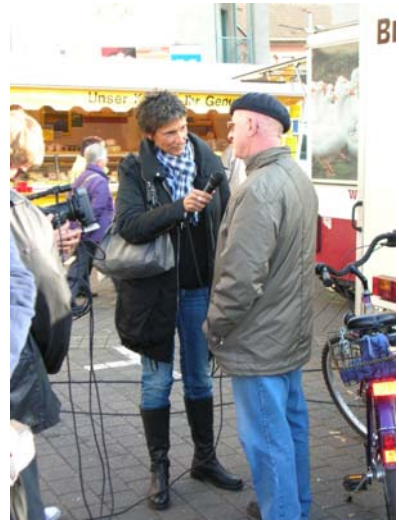
Videointerview auf dem Wochenmarkt in Menden

Der Erarbeitungsprozess wird abgerundet durch eine abschließende Vorstellung in Politik, Verwaltung und Stadtöffentlichkeit Anfang des Jahres 2011.