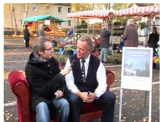
Das rote Sofa auf dem Wochenmarkt Platte Heide