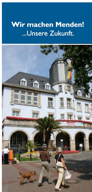
Titelblatt des Flyers zum Stadtprogramm

Auf diese und andere Fragen wollen und müssen wir überzeugende Antworten finden. Wir in Menden wollen unsere Chancen offensiv und vorausschauend nutzen. Unter Einbeziehung einer Vielzahl von Akteursgruppen haben wir eine gebündelte Zusammenstellung der Perspektiven für die Entwicklung unserer Stadt erarbeitet.